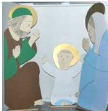
La crèche de quartier placée près du Fort de Lantin.

Pour faciliter votre promenade des crèches, un plan du village avec un parcours fléché indiquant l'emplacement des crèches sera affiché devant l'église, et des petits plans seront mis à la disposition des visiteurs. Cette année encore, Lantin vaudra le détour !